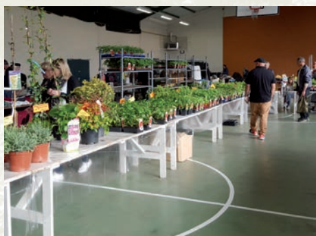
Marché aux fleurs.

Les 8 et 9 avril a eu lieu le « marché aux fleurs » à Os-Marsillon. Cette année encore, ces journées ont connu un beau succès, tant sur le plan organisationnel, humain, de l'affluence que financier. Pour rappel, les bénéficiaires sont réinvestis dans l'organisation de la journée « Vivre Ensemble ».