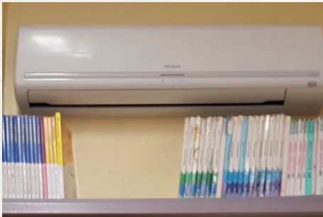
Climatisation à l'intérieur.

• Ecoles : l'été a été mis en profit pour mettre en place dans chacune des deux classes un système de climatisation réversible.