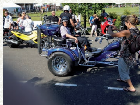
Journée « Vivre Ensemble »

« Vivre Ensemble » remercie tous les bénévoles pour leur participation, leur sourire et leur dévouement auprès des personnes porteuses de handicap tant attachées à la journée « Vivre Ensemble » et qui contribuent au succès de cette manifestation.