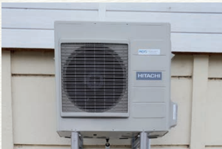
Climatisation à l'extérieur.

• Cantine scolaire : l'abri qui se situe dans la cour de la cantine scolaire va être agrandi afin de créer une salle où tous les enfants prenant leur repas à la cantine pourront se retrouver et attendre l'heure de la reprise des cours de l'après-midi